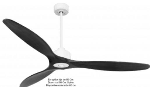
En option tige de 60 Cm Down rod 60 Cm Option Disponibile eadewide 60 cm