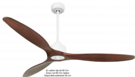
En option tige de 60 Cm Down rod 60 Cm Option Disponible également 60 cm