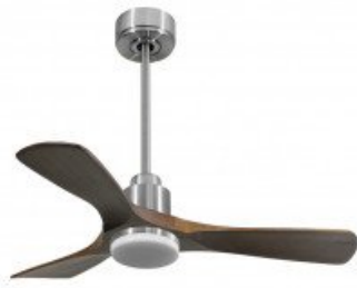
En option tige de 60 Cm Down rod 60 Cm Option Disponibile eadewise 60 cm