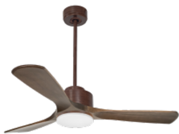
En opción eje de 60 Cm Down rod 60 Cm Option Disponible extensión 60 cm