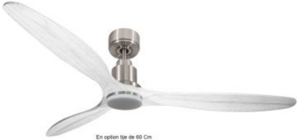
En option tje de 60 Cm Down rod 60 Cm Option