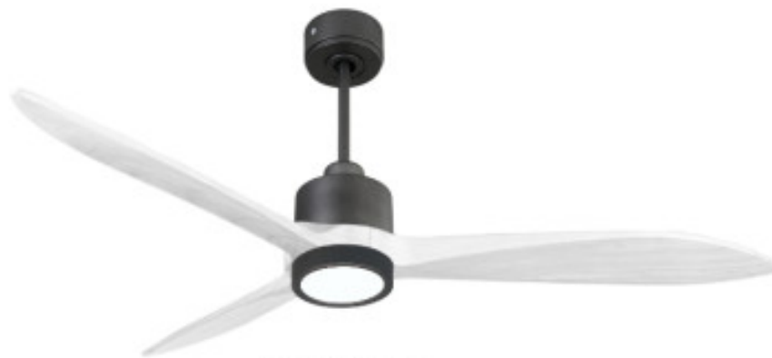
En option tige de 60 Cm Down rod 60 Cm Option

Un super destratificateur et un ventilateur de plafond moderne et modulable avec moteur DC hyper silence ,Wi-Fi, thermostat