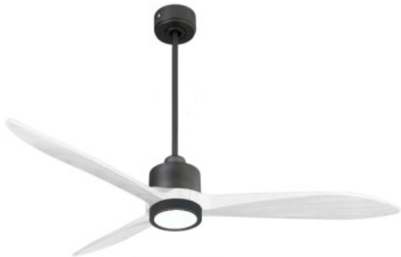
En option tje de 60 Cm Down rod 60 Cm Option