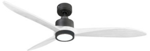
En option tje de 60 Cm Down rod 60 Cm Option