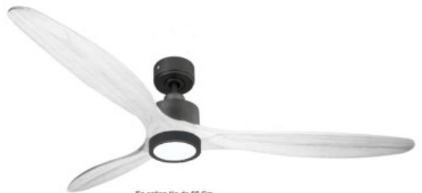
En option tje de 60 Cm Down rod 60 Cm Option