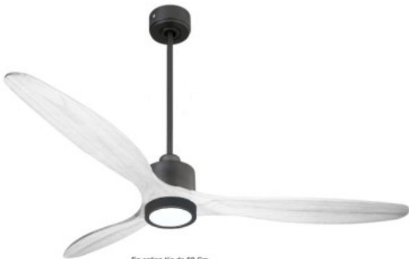
En option tje de 60 Cm Down rod 60 Cm Option