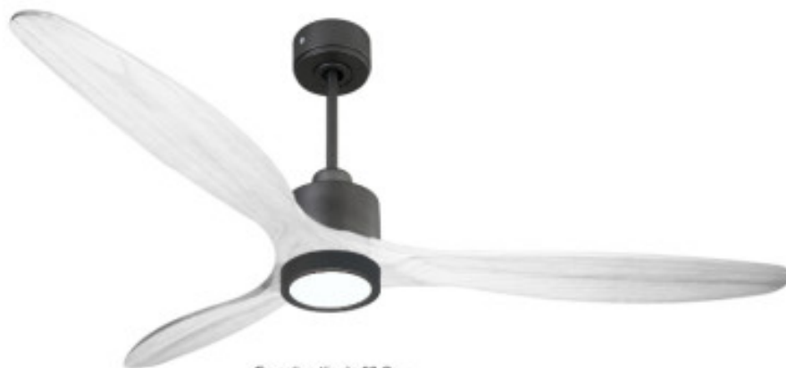
En option tige de 60 Cm Down rod 60 Cm Option

Un super destratificateur et un ventilateur de plafond moderne et modulable avec moteur DC hyper silence ,Wi-Fi, thermostat